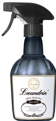
ランドリン ファブリックミスト ジャックミント 370mL / 547円(税込)

爽やかながらどこかスパイシーな個性が香る サンダルウッドやカルダモンを効かせた「ジャックミント」 柑橘系のフレッシュさと深みのあるウッディな清涼感が混ざり合った「ジャックミント」は、いわゆるミントの爽やかさだけではなくどこかエキゾチックな大人の香り。甘さ控えめなので男女問わず楽しめるのも魅力です。 またインテリアにも馴染むシックな佇まいは、クローゼットや玄関先などにもマッチ。あらゆるTPOで使えます。 存在感がありながらも静かな安らぎをくれる「ジャックミント」の香りをたとえば、空間だけでなく心までもすーっと整うよう。活力に満ちた明日のための“お守りミスト”です。