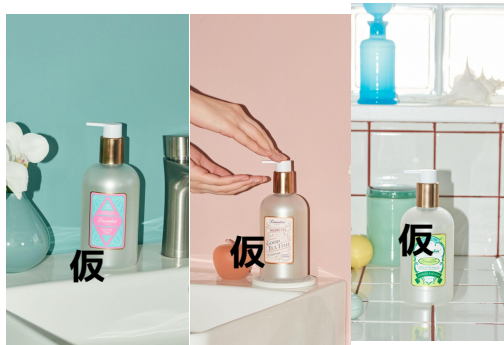
ランドリン GOOD TEA TIME アロマティックハンドソープ ホワイトティー/ウーロンティー/グリーンティーの香り 各320mL 1,430円(税込)

鉱物油フリー/シリコンフリー/エタノールフリー/パラベンフリー/サルフェートフリー/合成着色料フリー/石油系界面活性剤フリー