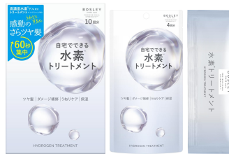
水素トリートメント