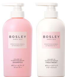
ボリュームアップ&リペア