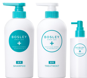
【薬用】スカルプケア

販売名：ボズレー シャンプー SC ボズレー トリートメント SC ボズレー エッセンス B