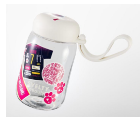
シェイカーに貼って楽しめる！