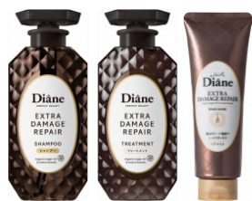
エクストラダメージリペア