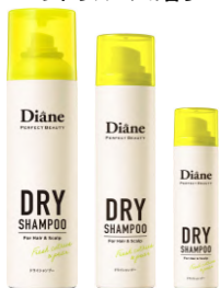
フレッシュ シトラスペアの香り

※出典：True Data（全国のドラッグストア、スーパーマーケットなどの消費者購買情報【ID-POSデータ】を統計化した日本最大級の標準データベース）において2020年1月～2025年12月にドライシャンプー年間売上ランキング1位（モイストダイアンパーフェクトビューティードライシャンプー フレッシュシトラスペアの香り95g）