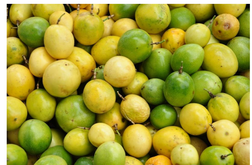
バージンマラクジャオイル※3