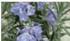
ローズマリー葉エキス