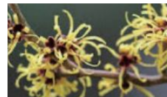
ハマメリス葉エキス