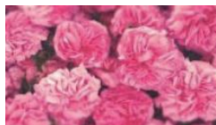
ダマスクバラ花水