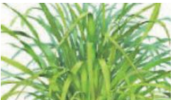
レモングラス葉／茎エキス