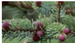
クロトウヒ樹皮エキス