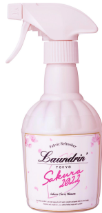
●ファブリックミスト 370mL 本体：521円