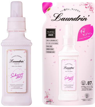
●柔軟剤 600mL 本体：731円 480mL 詰替：521円