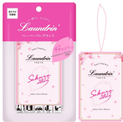
●ペーパーフレグランス 1枚入り：327円