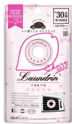
●クルマ用フレグランス 1個入り：506円