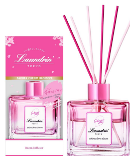
●ルームディフューザー 80mL 本体：913円