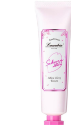
●モイストハンドクリーム 17g：495円