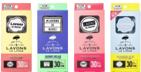
クルマ用フレグランス ゲルタイプ