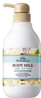
フルーティピュアサボン