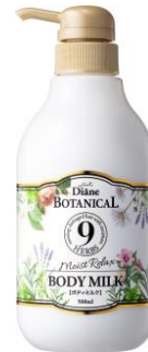
モイストリラックス