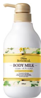
シトラス&ホワイトブーケ