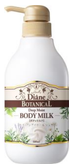
ディープモイスト