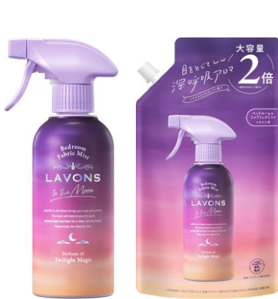
<ベッドルーム&ファブリックミスト> 本体 300mL 598円 (税込 657円) 詰替2倍 600mL 898円 (税込 987円)