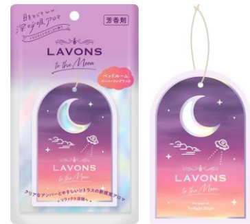
<ベッドルームペーパーフレグランス> 1枚入り 348円 (税込 382円)