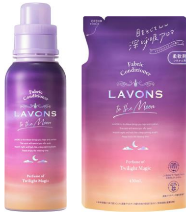
<柔軟剤> 本体 500mL 698円 (税込 767円) 詰替 430mL 498円 (税込 547円) 詰替2倍 860mL 898円 (税込 987円)