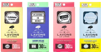
エアコン送風口用 クリップタイプ