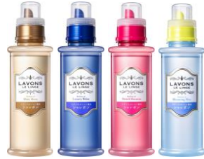
オシャレ着用洗剤