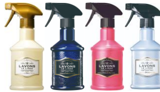
ファブリックミスト