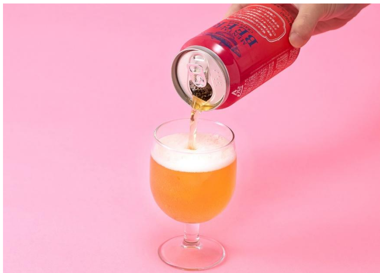
明太子に合うクラフトビール（イメージ）