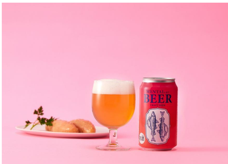
明太子に合うクラフトビール（イメージ）

な喉越しが心地よく引き締め、後味をすっきりと整えることで次の一口へと自然につながります。この食べ進めたくなるリズムを生み出せる点が、ビールならではの魅力です。開発にあたっては、「やまやの辛子明太子に合う一杯」をテーマに、数多くのクラフトビールから厳選。味わいのバランスや辛子明太子との相性を軸に比較・検討を重ね、最適な相性の商品を厳選しました。