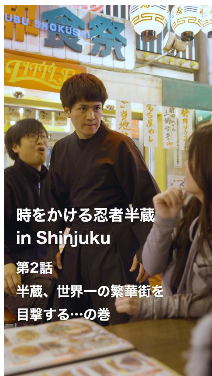
時をかける忍者半蔵 in Shinjuku