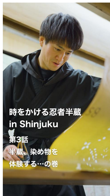
時をかける忍者半蔵 in Shinjuku