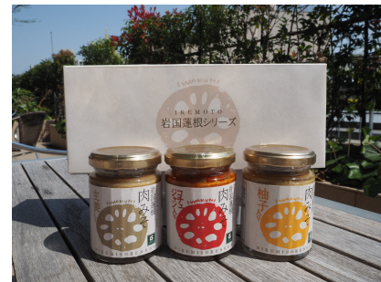
特産の岩国蓮根がたっぷり入った肉味噌 「岩国蓮根肉味噌」 （左から生姜、コチュジャン、柚子） 各500円税別