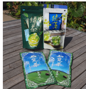
知覧茶各種 (季節によって入れ替え予定)