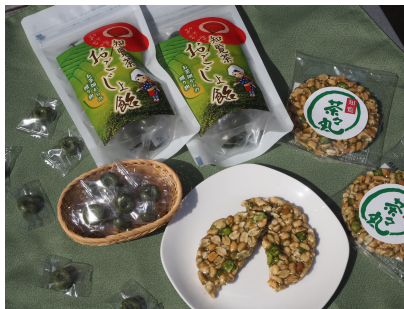
特産の知覧茶を使ったお菓子 「知覧茶おごじょ飴」400円税別(左)と 「茶々丸グリンピー」240円税別(右)