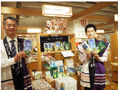
おすすめふるさと南九州市ブースと 南九州市役所のみなさん

鹿児島県からは初年度に薩摩川内市が きつませんだいら 出展して以来の出展となります。南九州市ブースでは、市町村別生産量日本一を誇る“知覧茶”の認知向上をはかるべく、茶葉、ティーバッグ、お茶を使用したお菓子等の知覧茶商品を中心に販売します。その他鹿児島焼酎、仏壇制作技術を生かした工芸品等もブースに並びます。