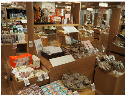
おすすめふるさと岩国市ブース

「【Event space】おすすめふるさと」への岩国市の出展は、萩市に続いて山口県では2自治体目となります（萩市も継続出展中）。これから岩国市ブースでは、「岩国といえばコレ！」という9つの特産品資源（岩国寿司、岩国れんこん、岸根（がんね）ぐり、こんにやく、地酒、高森牛、天然鮎、由宇（ゆう）トマト、わさび）を使用した様々な加工品等を販売します。