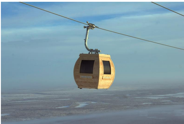
Sport Resort Ylläs