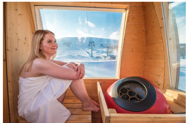
Sport Resort Ylläs

フィンランドの中でも特にスポーツが盛んであることで有名な Ylläs。冬の間はスキー場として人気があり、往復パスを購入すれば、ゴンドラで頂上まで登って絶景を楽しむことができます。Sport Resort Ylläs では、世界で唯一のゴンドラサウナも楽しめます。空と地上の間に浮かびながら、ラップランドの素晴らしい風景を眺めながらサウナに入ってスキーの一日を終えるのは、言葉では言い表せないほどユニークで忘れられない経験です。ゴンドラを使った 3 つのツアーがあります。各ツアーの所要時間は約 20 分。そこからの眺めも素晴らしく、運が良ければオーロラが見えるかもしれません。