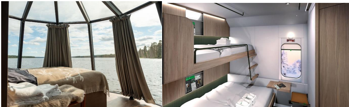
クレジット：（左）Aito Igloo &amp; Spa Resort、（右）VR Group