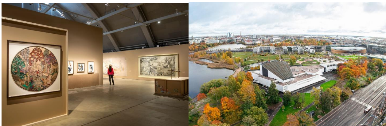
クレジット : (左) Installation view from Tove Jansson - Paradise. HAM Helsinki Art Museum 25.10.2024-6.4.2025. © Moomin Characters Oy Ltd. (右) Finlandia Hall

ムーミン 80 周年記念イヤー : 2025 年は、フィンランドで愛されている心温まるキャラクター、 ムーミン が 80 周年を迎える特別な年です。この節目を祝いムーミンの魅力を改めて称えるため、全国各地でさまざまなイベントが開催されます。