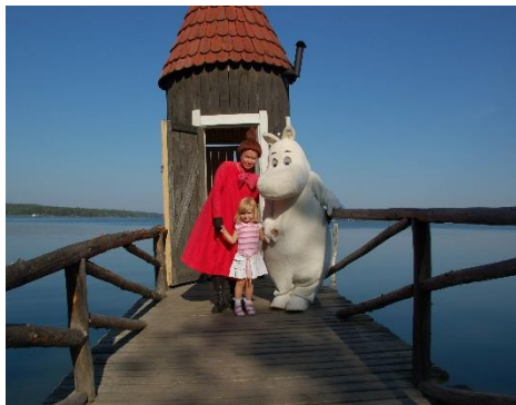
▲Photographer : Katja Lösonen