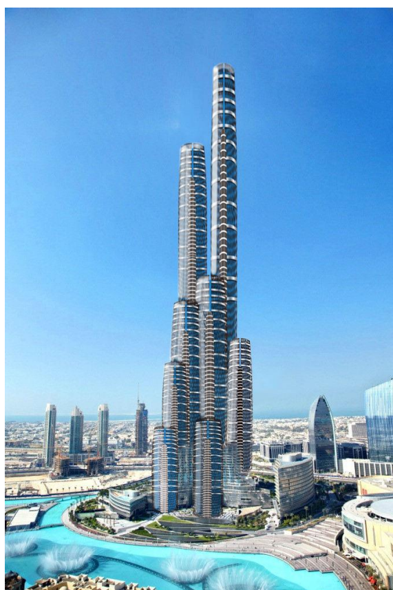
2022年 ドバイ 「TAKESUMI ヒルズ」