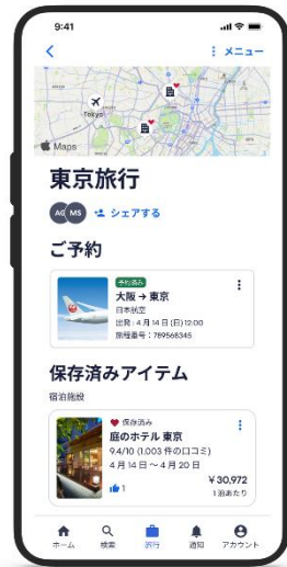
トリッププランナー