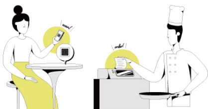
テーブルオーダー