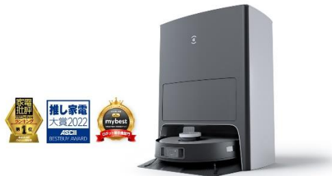
【DEEBOT X1 OMNI】 ・希望小売価格：198,000 円(税込)