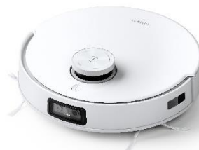
【DEEBOT T10】 ・オープン価格(希望小売価格)：109,800 円(税込)