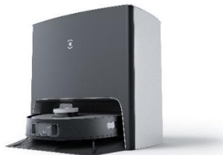
【DEEBOT X1 TURBO】 希望小売価格：159,800 円(税込)