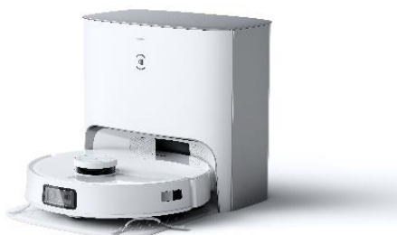
【DEEBOT T10 PLUS】 ・オープン価格(希望小売価格)：139,000 円(税込)