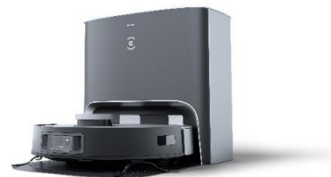
【DEEBOT X1 PLUS】 希望小売価格：158,000 円(税込)