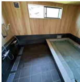
▲ ヒノキ張りの浴室