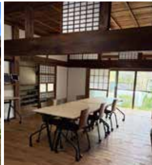
▲ 座学兼食事スペース