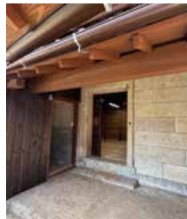
▲ 蔵を改修した事務所棟