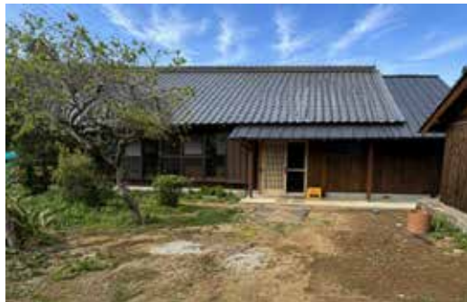
▲ 母屋を改修した宿泊研修棟