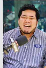
松井ケムリ （令和ロマン）

2003年生まれ、兵庫県尼崎市出身。AKB48元メンバー。卒業後『佐久間宣行のNOBROCK TV』への出演をきっかけにブレイク。現在は様々なフィールドで活動しながら、J-WAVE「GURU GURU!」の水曜ナビゲーターを務めている。