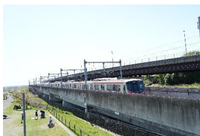
みらい平さくら公園