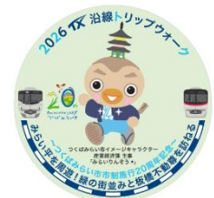
第2回 つくばみらい市