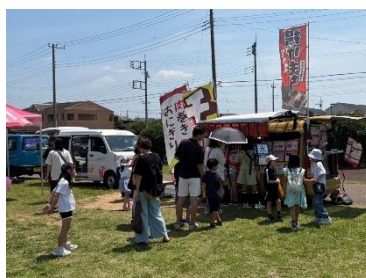
あさのいち 2025年開催時の様子