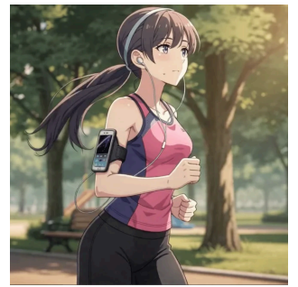
運動などのアクションも