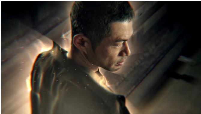
「光の ない もんじゃ屋 (休むイチロー)」篇 CMカット