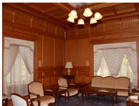
左：＜南玄関正面＞ルネサンス様式 半円アーチ型の窓 右：＜貴賓室＞天井・壁・全てケヤキむく板で作成