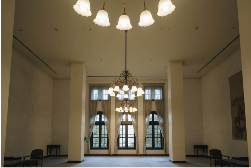
兵庫県公館 3階 南ロビー