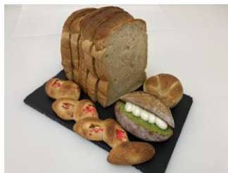
「KOTINI BAKERY」スペシャルセット例