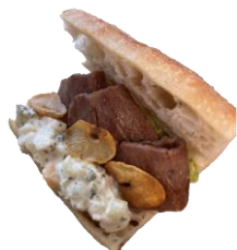
仙台牛と十和田ニンニクのバゲットサンド

各商品 1 日 30 個限定で、東北各県の名産品を組み合わせた「東北 6 県パン」を販売いたします。ここでしか味わえないコラボ商品ですので、是非お早めにお求めください。