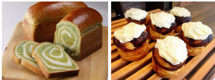
商品ラインナップ例

本イベント限定で、仙台で人気の3店舗が東北6県ゆかりの食材を使用した全3種の「東北6県パン」を販売します。宮城県の仙台牛と青森県の十和田ニンニク、秋田県の比内地鶏と福島県のハバネロ味噌、岩手県のくずまき高原牧場クリームチーズと山形県のさくらんぼを使用したパン・スイーツをご用意しました。本イベントならではの東北名産食材の組み合わせをご堪能ください。