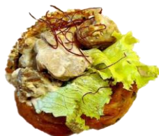
秋田県産比内地鶏×福島県産ハバネロ味噌の韓国風サンド