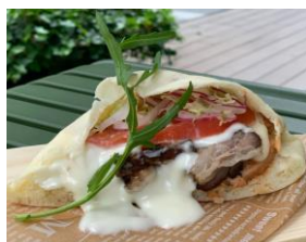
「ポークケバブと地場野菜のピタサンド」