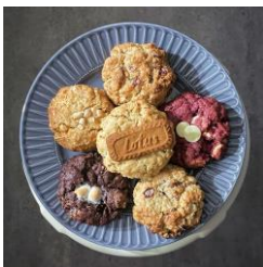
「Pie at...」スペシャルセット例