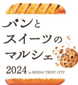
パンとスイーツのマルシェ 2024 ロゴ

森トラスト株式会社(本社:東京都港区 代表取締役社長:伊達 美和子)は、2024年6月7日(金)・8日(土)に「パンとスイーツのマルシェ 2024」(以下、本イベント)を仙台トラストシティにて開催いたします。人気店が一堂に会し、東北各県の名産品を組み合わせた「東北 6 県パン」の販売やピアニストによるミニコンサートなど、多数のコンテンツをご用意しております。