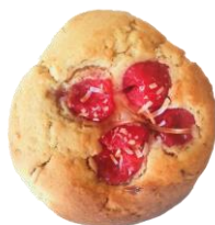
山形チェリー&くずまき高原牧場 クリームチーズマフィン