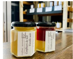
「salz」スペシャルセット例