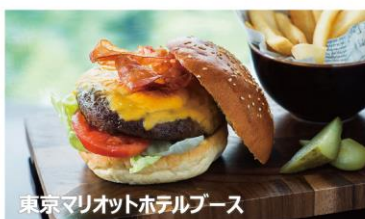
東京マリオットホテルブース