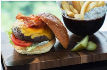
マリオットバーガー・マリオットクリームソーダ

東京マリオットホテルより「マリオットバーガー」やハーゲンダッツバニラアイスクリームを使用した「マリオットクリームソーダ」が特設ブースにて提供されるほか、ピザやローストビーフ、モチコチキンなどのキッチンカーが並び、多彩なメニューでお花見気分を盛り上げます。