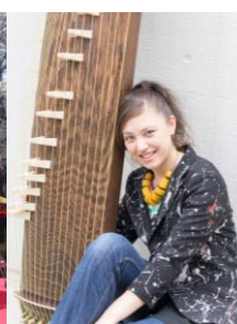
マクイーン時田深山