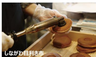
しながわ目利き市