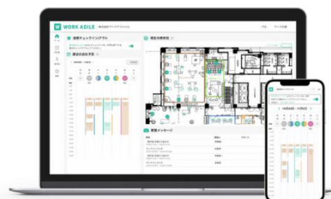
▲「WORK AGILE」使用画面(イメージ)