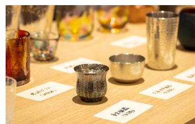
工芸バー イメージ

ご好評につき、本年 3 回目の実施となる「工芸バー」。CoCo JAPAN パートナー企業である日本工芸堂と共催の、各地の工芸品酒器で地酒を味わう懇親の場です。工芸品(陶磁器、金属、ガラスなど)での酒器体験を通して、工芸についての理解を深めることができます。今回は、福島県会津地方の料理を福島のお酒とともに会津塗の器にてご提供いたします。