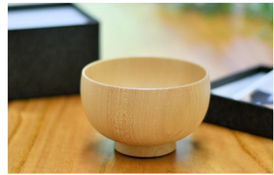
山中漆器 しらさぎ椀