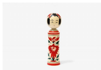
こけしのしまぬき 展示商品イメージ 当社グループ運営のウェスティンホテル仙台内セレクトショップ「せんだいスーベニア」でも販売しております。

こけしのしまぬき(宮城県仙台市)/修善寺紙谷和紙工房(静岡県伊豆市)/民藝麦わらの店 晨(あした)(静岡県伊豆市)/箱根寄木細工(神奈川県箱根町)/山中湖陶芸倶楽部(山梨県山中湖村)