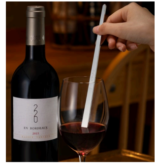
味が変わる?! 不思議なマドラー体験 イメージ

CoCo JAPAN 展示コーナーで人気のステンレスマドラーを神谷町の本格グリルレストランにて体験いただけます。ステンレスマドラーには、特殊加工が施されており、ワインをはじめとした飲み物を攪拌すると雑味をとり、口当たりを滑らかにします。日本の技術力と、繊細さを追求した逸品をぜひお試しください。