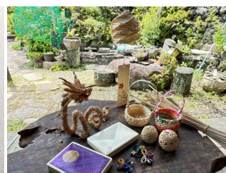
民藝麦わらの店 晨 展示商品イメージ