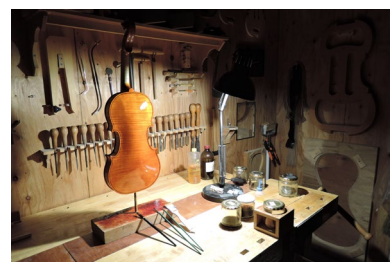
国産の弦楽器による「ミニコンサート」 イメージ

参加方法： 「TOKYO WORLD GATE CoCo Lounge」LINE アカウントへ登録いただき、お時間までに会場へお越しください。 LINE アカウント登録はこちらから(リンク: https://lin.ee/XH1LhmH ) なお、お座り頂ける席には限りがございます。