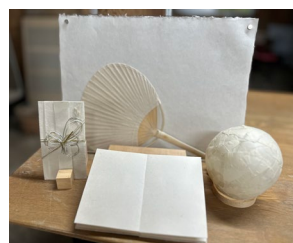
修善寺紙谷和紙工房 展示商品イメージ