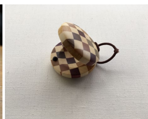
箱根寄木細工 展示商品イメージ