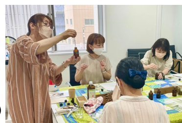
「オリジナルディフューザーづくり」イメージ

宮城県・秋保ワイナリーで廃材となった葡萄のツルをご自身で剪定いただき、ミニリードディフューザーをつくります。香りとともに、オリジナルのディフューザーをお持ち帰りいただけます。