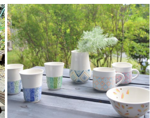
山中湖陶芸倶楽部 展示商品イメージ