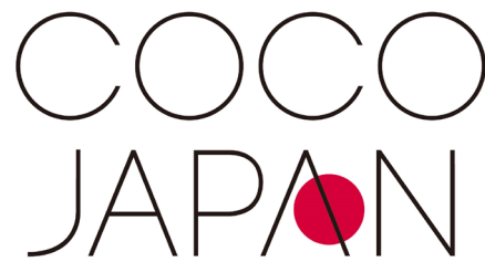
CoCo JAPAN ロゴ