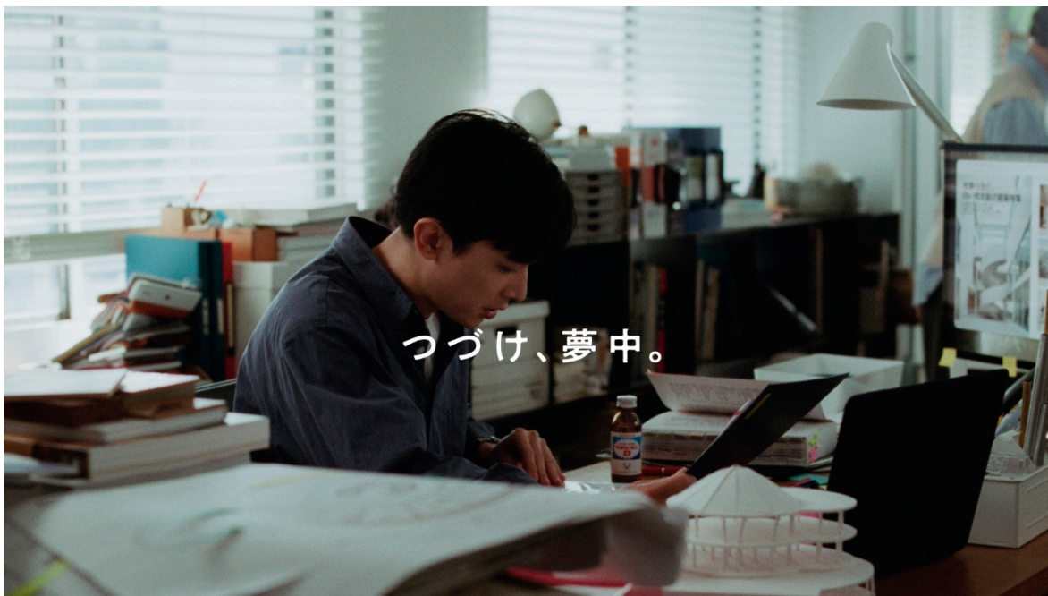
リポビタンDays 新TV-CM『僕のリポビタンDays（登場）』篇より

吉沢さんの「頑張ったっていいだろ！！」の言葉とともに 日常の頑張りがやひたむきな努力に寄り添う新TV-CM リポビタンDays 新TV-CM『僕のリポビタンDays（登場）』篇 4月14日（火）から全国でオンエア開始