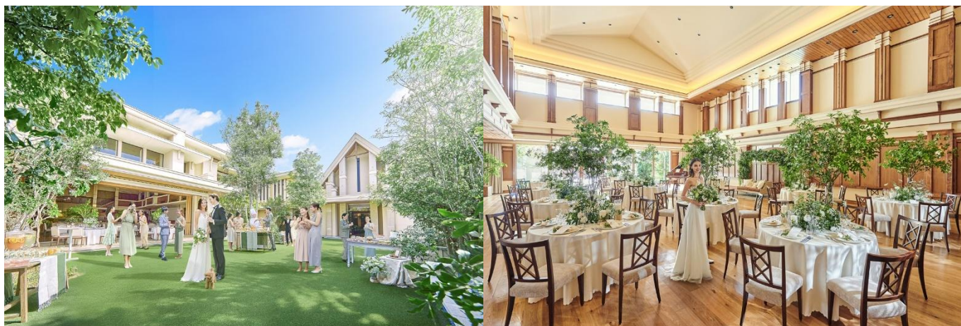
※完成予想図・イメージ