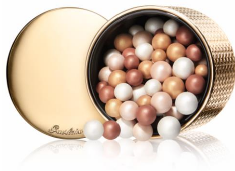
メテオリット ビュー エレクトリック パール(フェイスパウダー) 限定1種 8,100円(税抜)

ラグジュアリーなゴールド パッケージには、全てがパーリーな 4種類のカラーパールが収められ、ホリデイシーズンにふさわしい、 艶やかに輝く肌を演出します。