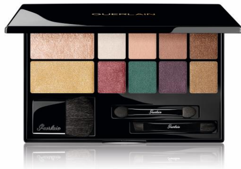
パレット エレクトリック 限定1種 9,300円(税抜)

完璧なハーモニーを奏でるカラーセレクション マットとメタリックのアイシャドウ8色に2色のハイライター、 3種のアプリケーターが付いたパレット。 これひとつでトレンドのホリデイ ルックが完成します。