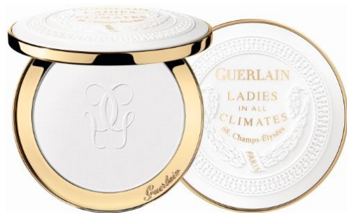
レイディース イン オール クライメット(フェイスパウダー) 限定1色 23,100円(税抜)

・シアーマットでプレミアムな美しい仕上がり プレミアム パウダーならではの洗練されたシアーマット仕上がり。 フェザーのように軽やかなパウダーが肌悩みを消し去り上質な美肌を叶えます。