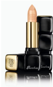
501 エレクトリック ゴールド

とろけるようなテクスチャーがふっくら潤った「誘惑する唇」を叶えてくれるキスキスの限定色。他のカラーに重ねてニュアンスを楽しめます。