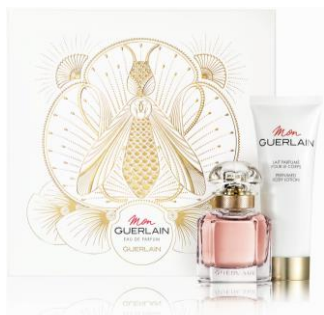
モン ゲラン オーデパルファン コフレ

ゲランで人気のフレグランスとボディローションがセットになったクリスマスコフレ。大切な人への贈り物や自分へのプレゼントにぴったりです。