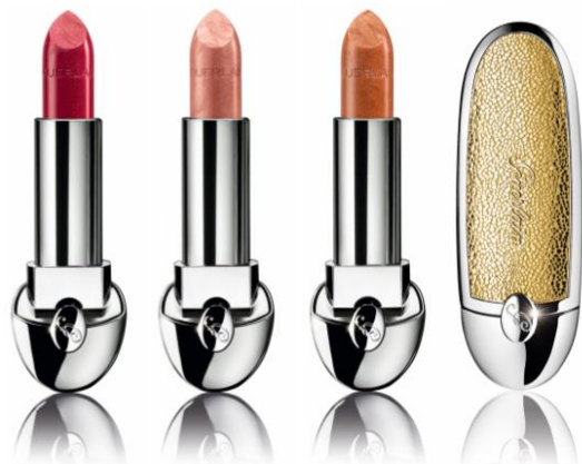
091 メタリックな ローズ レッド 092 メタリックな ピンク ベージュ 093 メタリックな 銅 エレクトリック ゴールド

大人気のルージュ ジェから “エレクトリック”なルックを叶えるカラーとケースが登場。 カラーとケースを自由に組み合わせ、ファッションを楽しむように リップを選べる大人気のルージュ ジェから、メタリックなリップ カラー3色と、幸運を引き寄せそうなリュクスなゴールドレザー テイストのケースが登場。ホリデイシーズンにふさわしい3色の メタリックカラーがこの時期のルックをより魅力的に演出します。