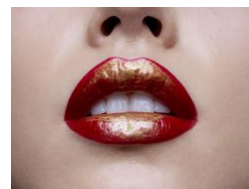
贅沢な唇のためのジュエリー

・極上の付け心地はそのまま贅沢な唇のためのジュエリー 鮮やかな発色、宝石のような輝きと圧倒的なツヤで唇をまるでジュエ リーのように仕上げます。