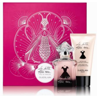
ラ プティット ローブ ノワール オーデパルファン コフレ