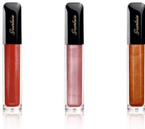
921 エレクトリック レッド 862 エレクトリック ピンク 903 エレクトリック カッパー

濡れたようなつややかさと、メタリックな煌めきが楽しめる、輝きを帯びたベルヴェットのような仕上がり。