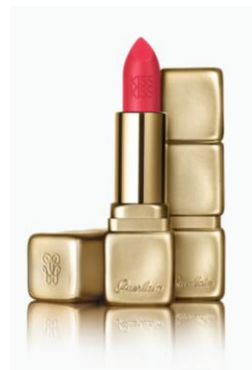
M332 エレクトリック ルビー

なめらかでボリュームミ、リッチで潤いに満ちたマットリップの限定色は、明るいレッドカラー。