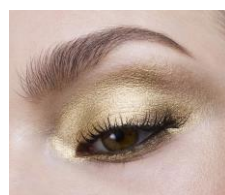
ウェット&ドライの2WAY

ゴージャスなトレンドアイメイクがいつでもどこでも楽しめるように、 3種のアプリケーターがケースにイン。 (チークブラシ、アイシャドウチップ、アイシャドウブラシ)