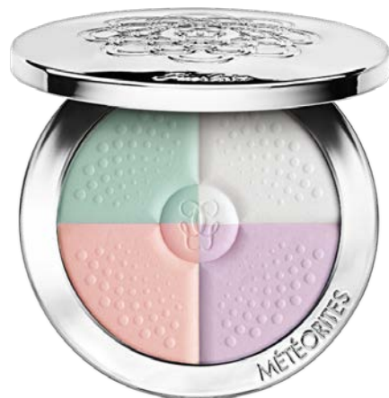
メテオリット コンパクト 新3種 7,400円(税抜)

・肌トーンや目的にあわせて選べる3つのハーモニー 仕上がりや目的に合わせて選べるシェードが、理想的な肌色を実現。