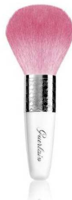
メテオリット ブラシ 5,200円(税抜)

ピンクの毛先は柔らかい毛質で優しい肌触り。 たっぷりとしたボリュームでシルクのようなしなやかな肌触り。 極上の心地良さをもたらす最高級のヤギの毛を使用しています。 水洗いできるケース入りでいつも清潔な状態に保てます。