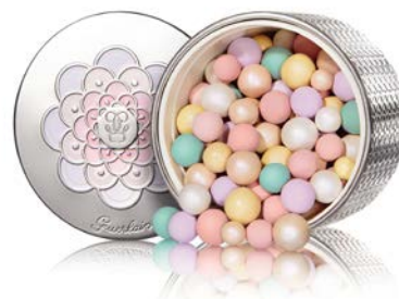
メテオリット ビージュ 全4色 7,700円(税抜)

一瞬であらゆる肌に輝きと明るさをもたらす“魔法のパウダー” 目に見えない光までキャッチし、輝きに満ち溢れた肌に仕上げる「スターダスト テクノロジー」を採用。 どんなスキントーンにもマッチし、ピュアな輝きを添え顔色を補整しながら明るさを与える6色パールによって、透明感溢れる明るい肌色を叶えるパウダーです。