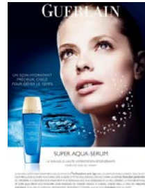
2008年 「スーパー アクア セロム N」