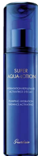
スーパー アクア ローション N (化粧水) 150mL 6,600円(税抜)