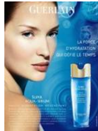
2005年 「スーパー アクア スーパー セロム」