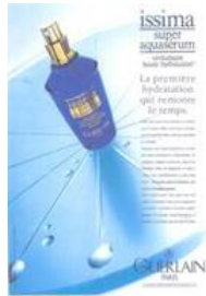
1995年 issima 「スーパー アクア セロム」