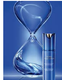
2012年 「スーパー アクア セロム」