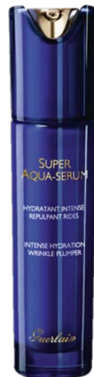
スーパー アクア セロム N (美容液) 30mL ¥16,800(税抜) 50mL ¥23,700(税抜)