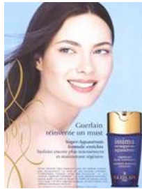
2000年 issima 「スーパー アクア アドバンスト フォーミュラ」