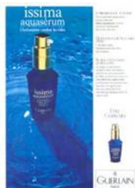
1987年 「アクア セロム」

「スーパー アクア」は季節や年齢を問わず、保湿強化に抜群の効果を発揮。まるで万能薬のように、悩み別のエイジングケア製品に組み合わせ、プラスして使っていただくより効果的なエイジングケアが実現できます。