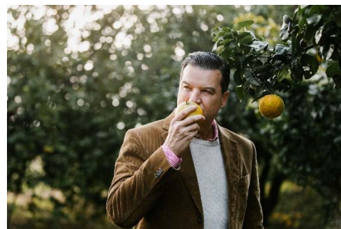
5代目調香師 ティエリー・ワッサー

ティエリー・ワッサーは、香水の歴史を作ってきた4世代の調香師たちに続く優れた継承者です。