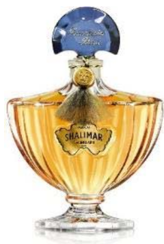
香水 7.5mL 16,600円(税抜) 30mL 4,000円(税抜)