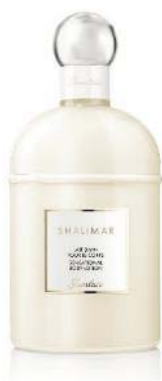
ボディローション 200mL 7,500円(税抜)