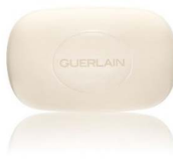
パフューム ソープ 100g 3,600円(税抜)