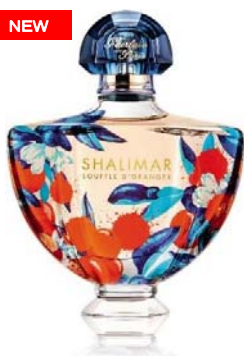
スフドラージュ 50mL 12,600円(税抜)