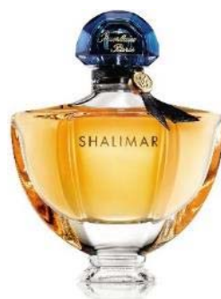
シャリマー オーデパルファン 50mL 12,600円(税抜)