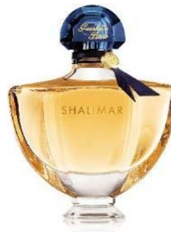
オーデフレ 50mL 10,300円(税抜)