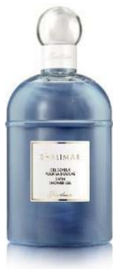
シャワージェル 200mL 6,300円(税抜)