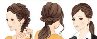
編み込み ゆるふわアレンジ キッチリアレンジ

使用方法 : まとめ髪をつくる前に、髪全体を軽く湿らせる程度スプレーし、くしや手ぐしでなじませてから髪をまとめてください。