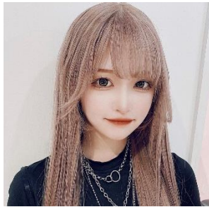
ハウスダストさん