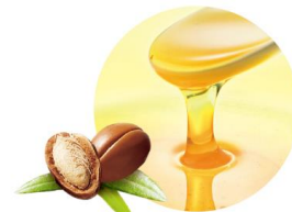
アルガンオイル (アルガニアスピノサ核油)