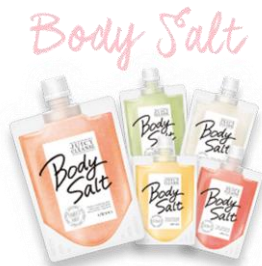
ジューシィ果実のボディススクラブ