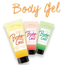
ひんやり果実のボディジェル