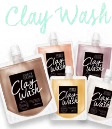
カラフルクレイの泥洗顔