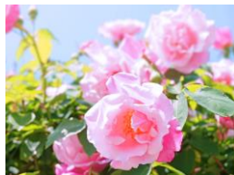
ダマスクローズ水※2