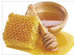
ダマスクローズハチミツ (すべて保湿成分)