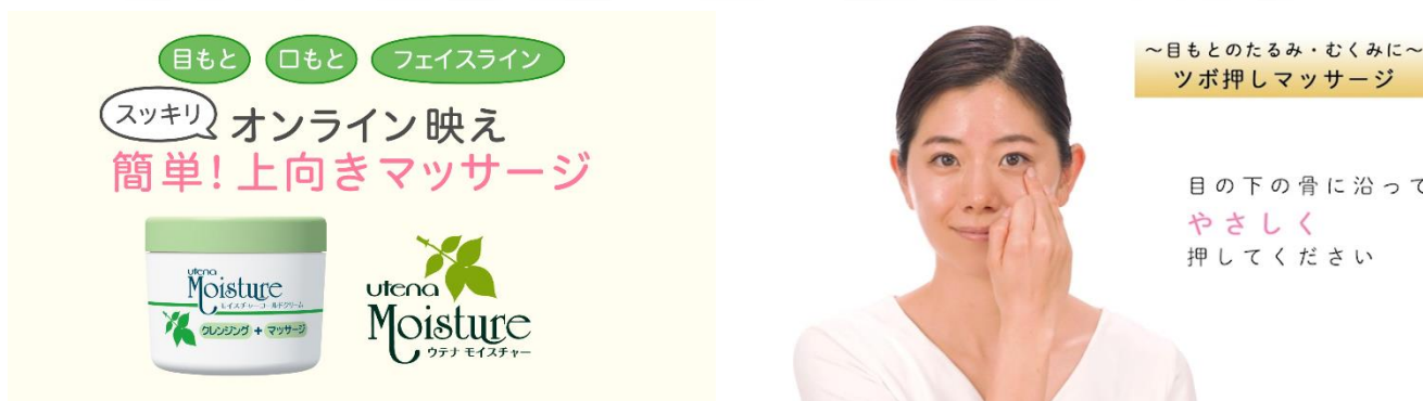
目もと・口もと・フェイスライン パーツ別マッサージ動画