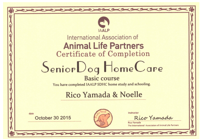
受講者と愛犬の名前入り終了証