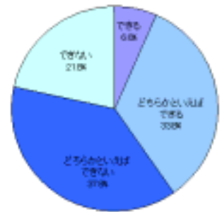
運を自分でコントロール できるか

「運を自分でコントロールできると思いますか」という質問に対し、「できない」21.8%、「どちらかと言えばできない」37.8%と、 約 6 割の人は自分の運をコントロールする事はできないと考えていることがわかりました。