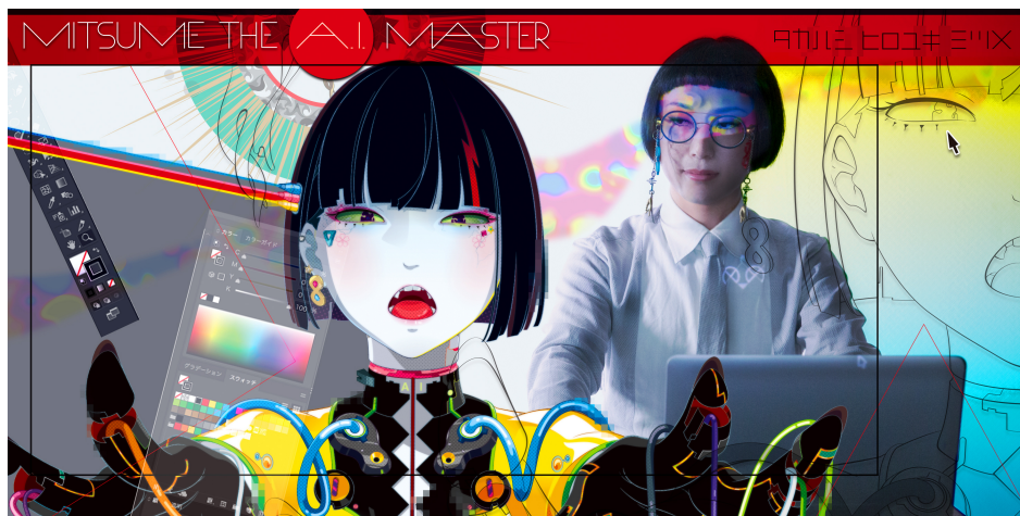
『Mitsume the A.I. Master』キービジュアル