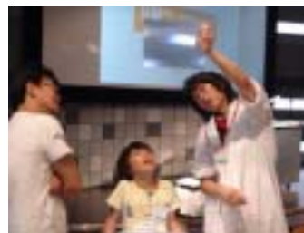
「分解ワークショップ」(過去の様子)