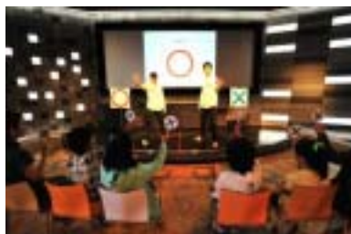
「サイエンス × サバイバルクイズ」