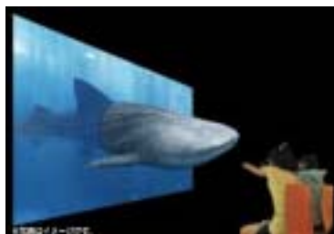
3D映像上映時(イメージ)

【上映会場の紹介】 サイエンスシアター: 3D映像やHDオリジナルサイエンス番組が満喫できる160インチのスクリーンを有する多目的シアターです。映像上映のほかに、ミニ実験を交えた参加型ライブショー「サイエンス × サバイバルクイズ」(土日祝日開催: 自由参加) やソニーのエンジニアや研究者が講師となる様々なワークショップ(不定期開催: 要予約) など、大人も子供も楽しめるサイエンス・エンタテインメントをご提供しています。