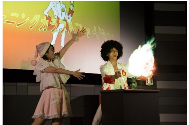
＜科学実験ショーの様子＞