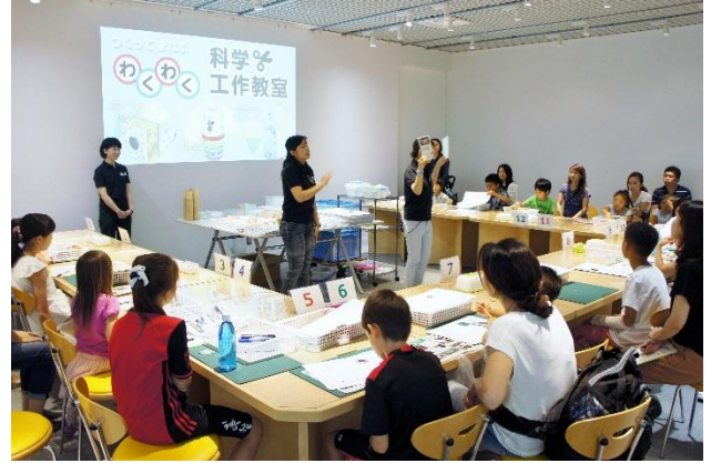
<「わくわく科学工作教室 第1弾 光編」の様子>