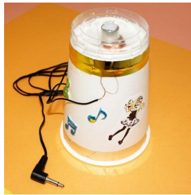
紙コップスピーカー