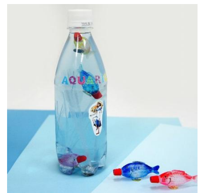
うきうきフィッシュ