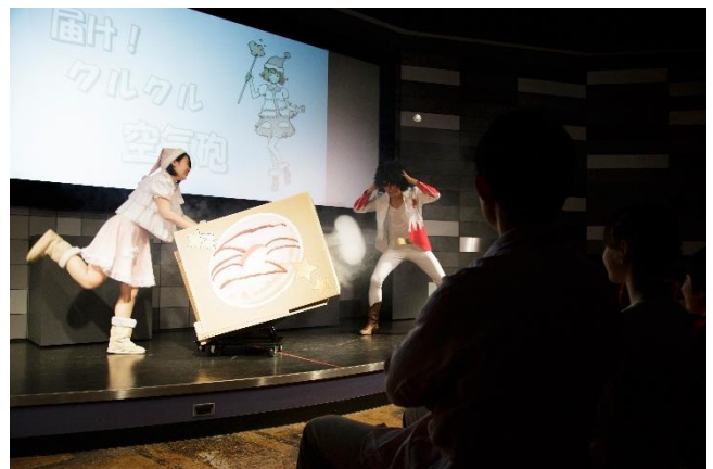
<実験ショーの様子>